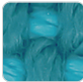
aquamarine 10003 getaria

Tejido premium 1005 acrilico, con una alta densidad, presente en una amplia gama de colores.