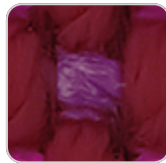
aphrodite 10013 getaria