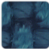
green 10053 getaria